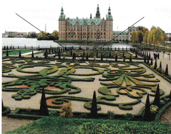
Rys. 20. Kłomb w ogrodach potocznych (Frederiksborg, Dania)