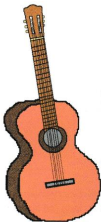
Rys. 10. Gitara