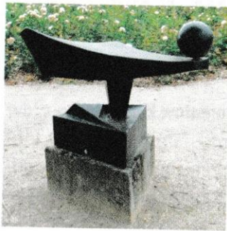
Rys. 21. Rzeźba (Schwerin, Niemcy) i rzutkadrowy